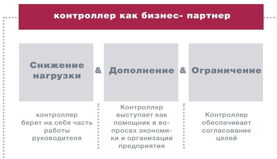
Рис. 3. Поддержка менеджера контроллером (по Веберу/ Шефферу)

С точки зрения бизнес-партнерства, сотрудничество менеджера и контроллера должно реализовываться «на равных». Хотя направление деятельности задает менеджер, сегодня контроллер также несет ответственность за достижение целей предприятия. Таким образом, контроллеру не следует пассивно ждать указаний руководителя; его роль как бизнес-партнера для менеджера заключается в упреждении и дополнении действий последнего . Это относится как к ежедневным обязанностям, так и к принципиально новым сферам деятельности, например, таким как ориентация на управление стоимостью или устойчивостью функционирования предприятия. Роль контроллера как бизнес-партнера заключается в распознавании и развитии подобных тем. При этом, с одной стороны, все большее значение придается способности контроллера совмещать активное участие в управленческом процессе с внесением собственных идей, а с другой, выполнять функцию блюстителя интересов предприятия и критически настроенного партнера или «спарринг-партнера» («вовлеченность или независимость»). Контроллеры должны быть в состоянии усидеть на двух стульях.